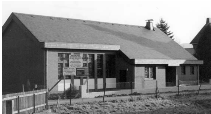
Bilder oben: Front- und Seitenansicht der neu gebauten Kirche